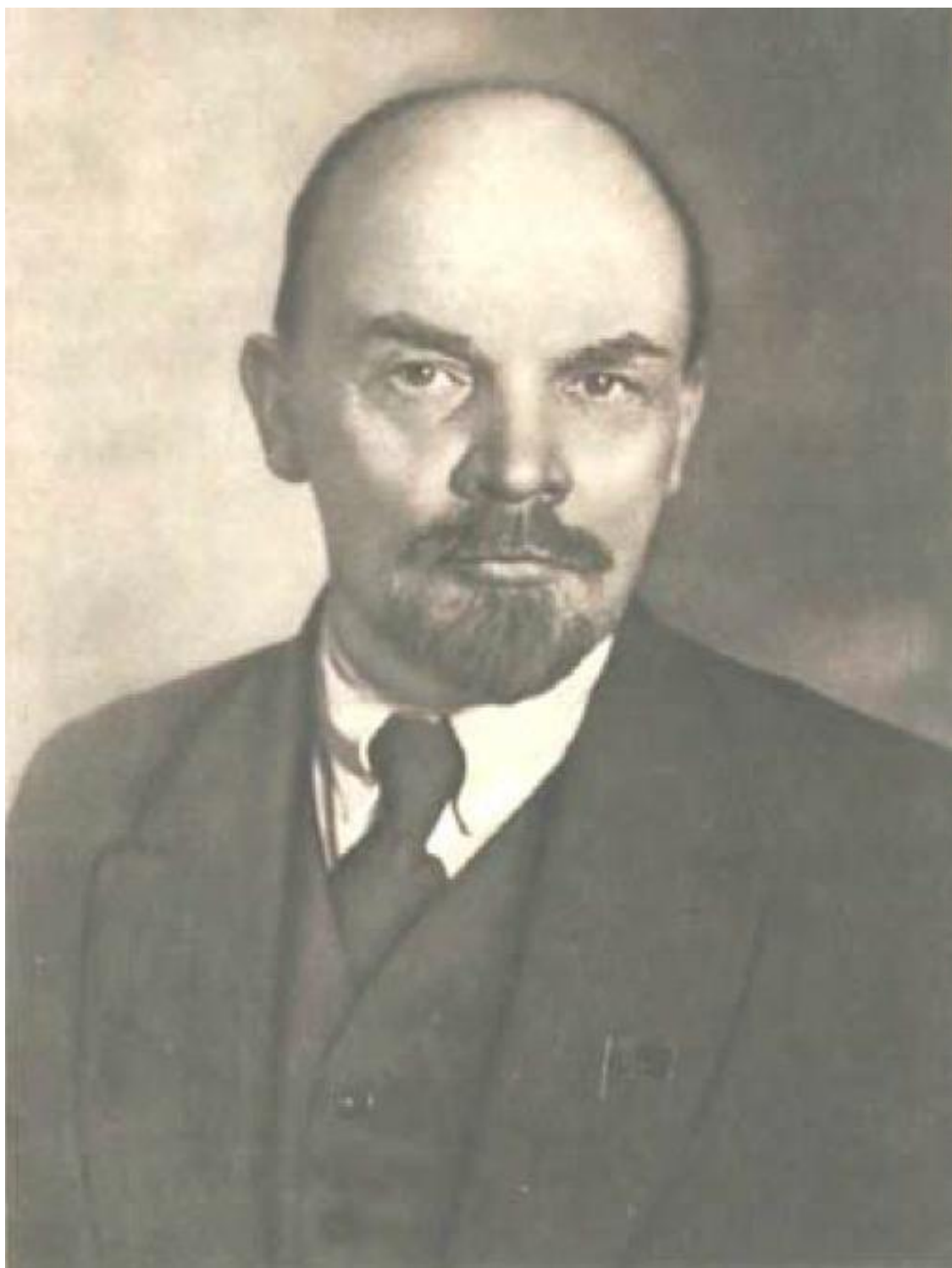
В. И. Ленин (1920)