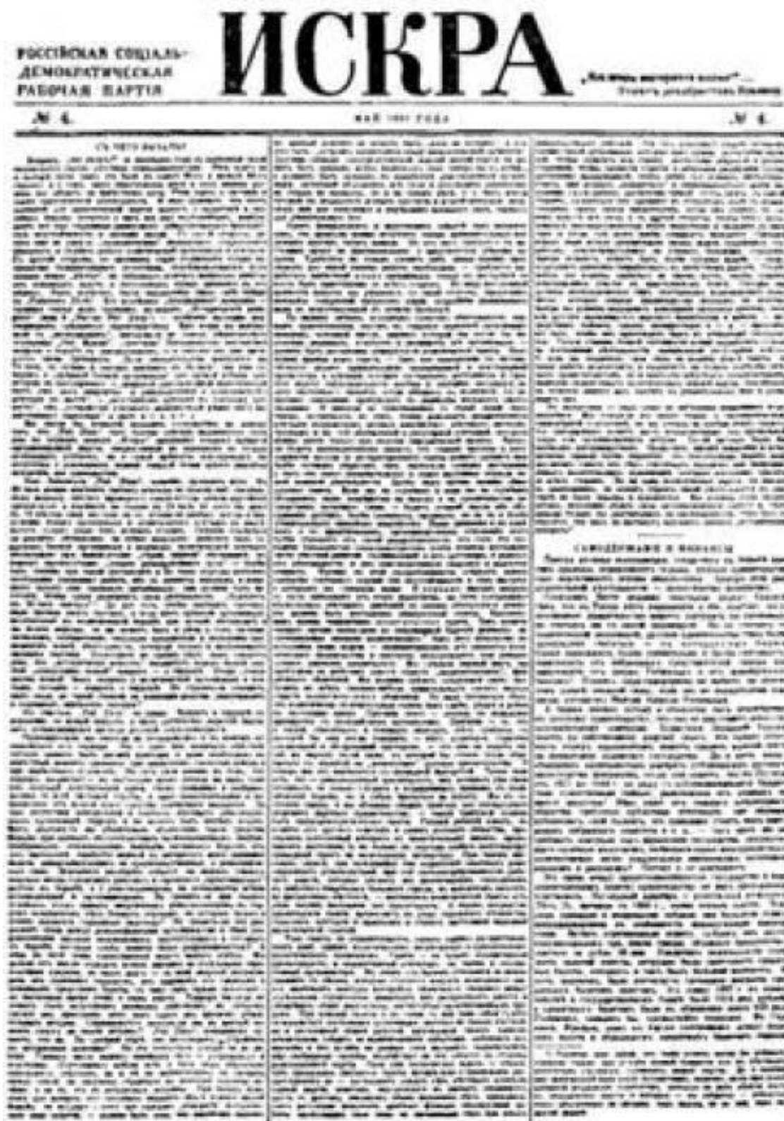
Первая страница газеты «Искра» № 4 со статьей В. И. Ленина «С чего начать?»– 1901 г. (Уменьшено)

Вопрос: «что делать?» за последние годы с особенной силой выдвигается перед русскими социал-демократами. Речь идет не о выборе пути (как это было в конце 80-х и начале 90-х годов), а о том, какие практические шаги и как именно должны мы сделать на известном пути. Речь идет о системе и плане практической деятельности. И надо признать, что этот основной