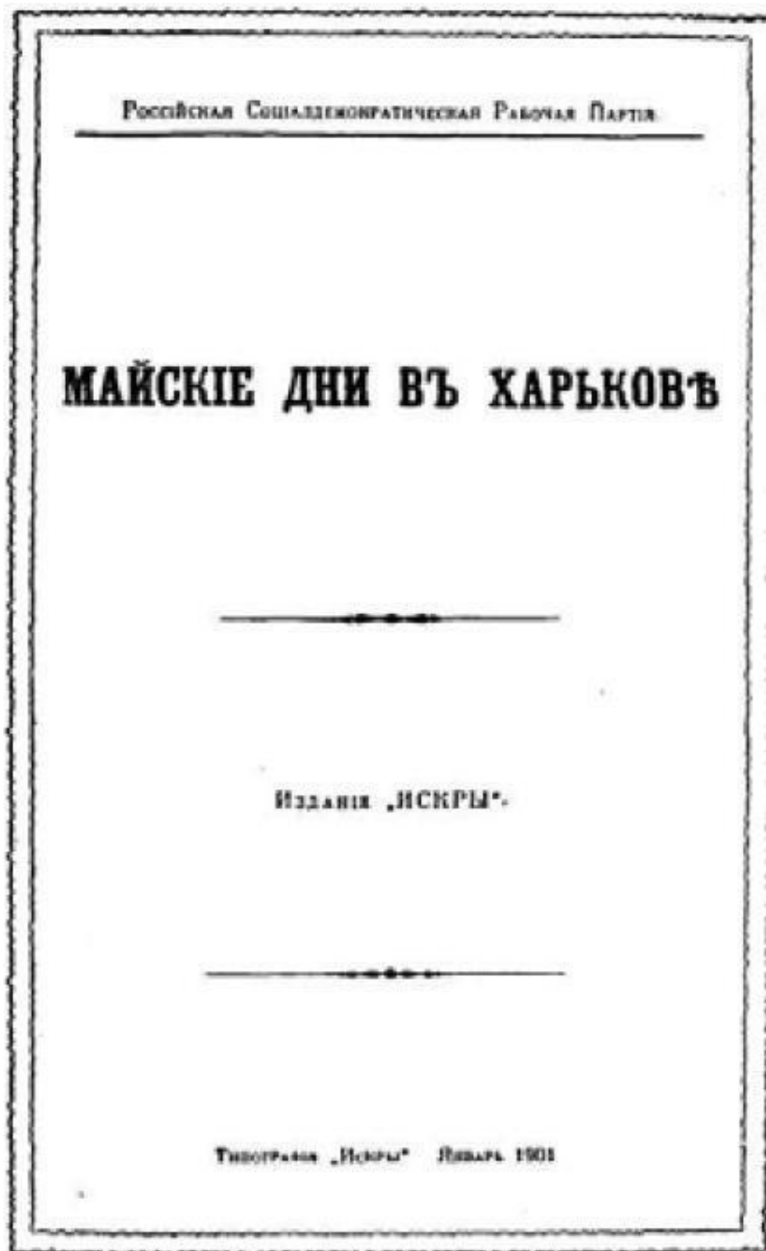
Обложка брошюры «Майские дни в Харькове». – 1901 г.