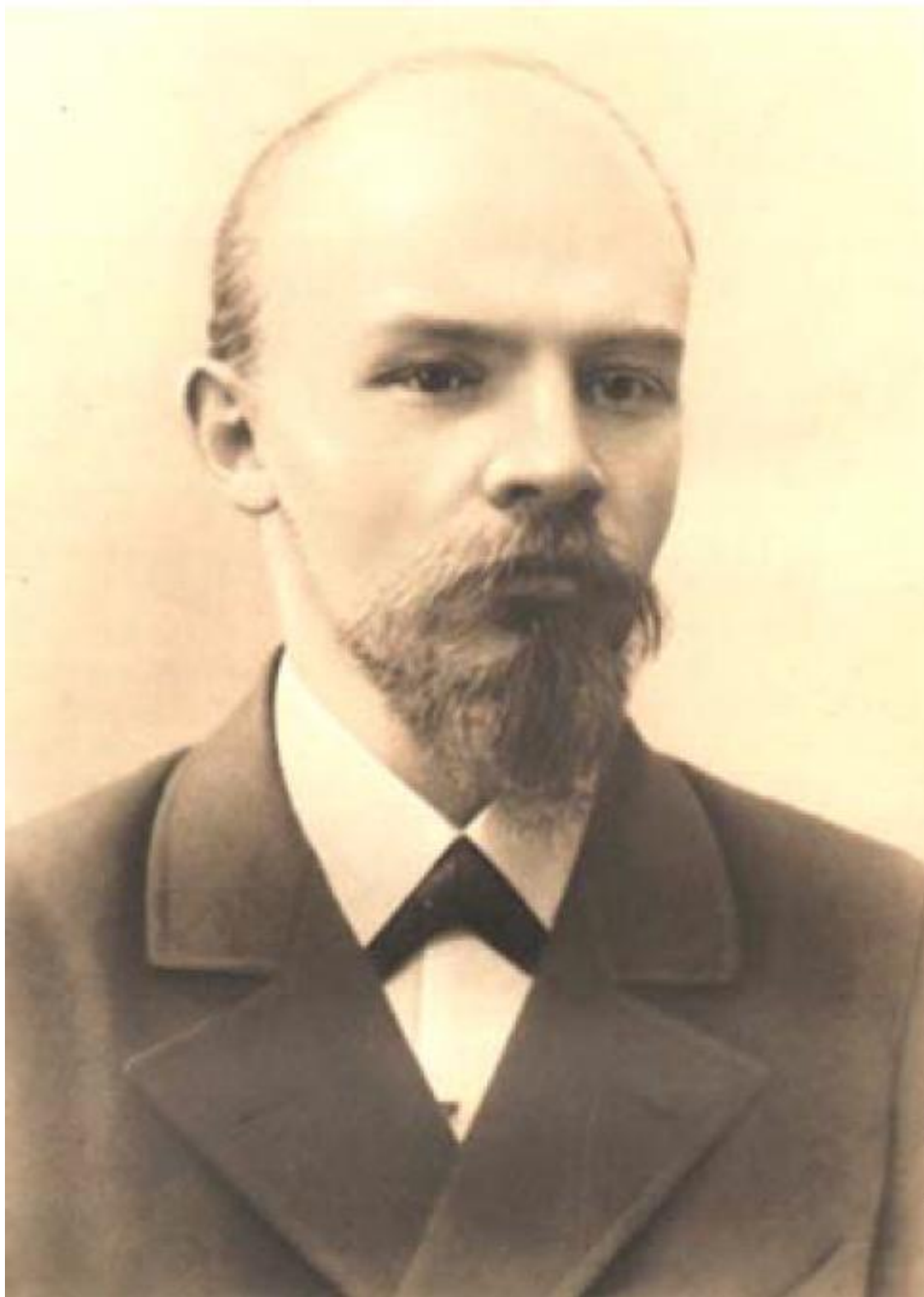
В. И. Ленин (1897)