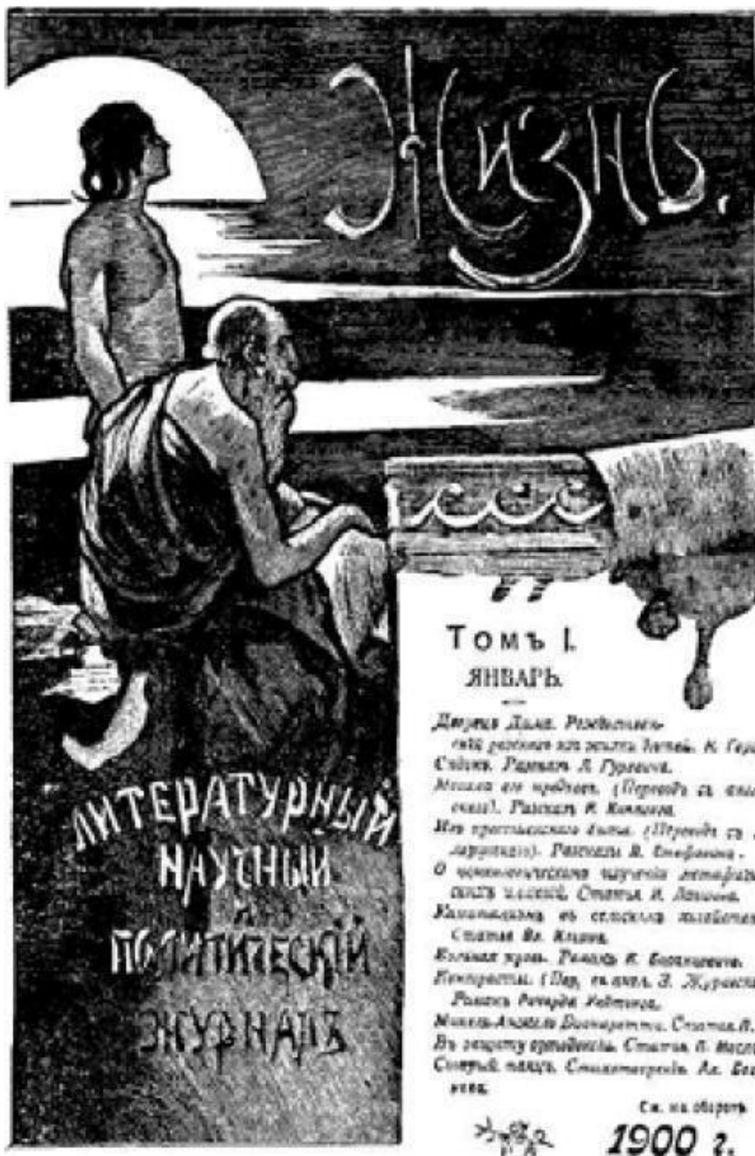
Обложка журнала «Жизнь», в котором была напечатана статья В. И. Ленина «Капитализм в сельском хозяйстве». – 1900 г. (Уменьшено)